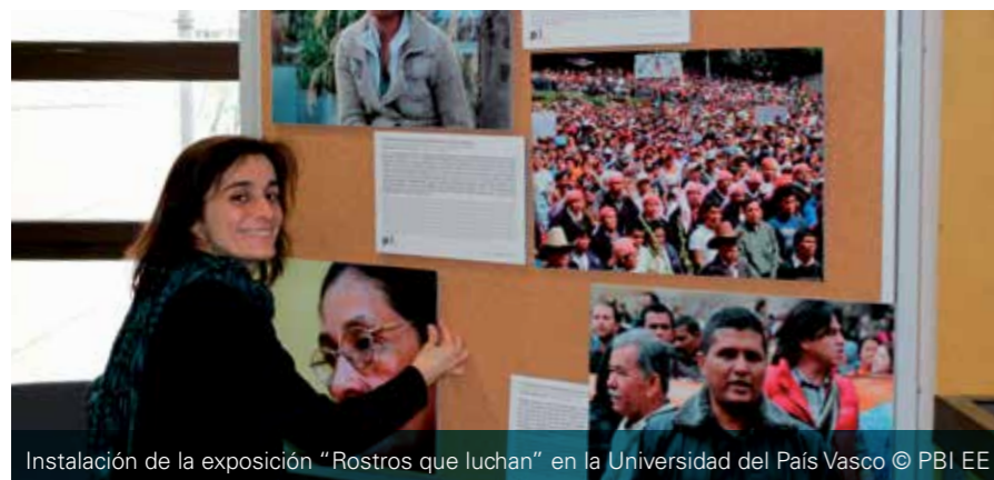
Instalación de la exposición "Rostros que luchan" en la Universidad del País Vasco

En el mes de diciembre se pudo visitar en el Espacio Antonio Miró Peris de Barcelona.