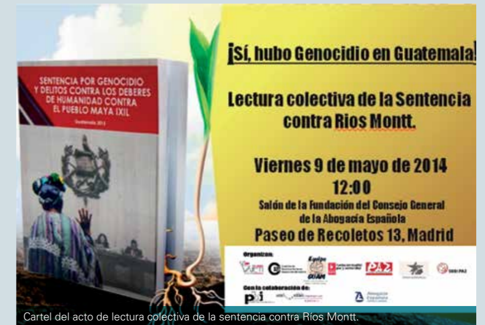
Cartel del acto de lectura colectiva de la sentencia contra Ríos Montt.

En torno al día 25 de noviembre se organizaron en Santander y Reinosa, en colaboración con MUNDUBAT y La Vorágine, las conferencias "Violencias contra las mujeres indígenas en el mar-